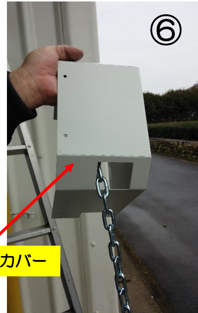
チェーンホイールカバー