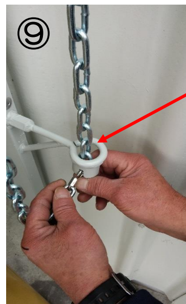
チェーン止め金具